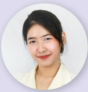
ปภาดา ราษฎร์อน