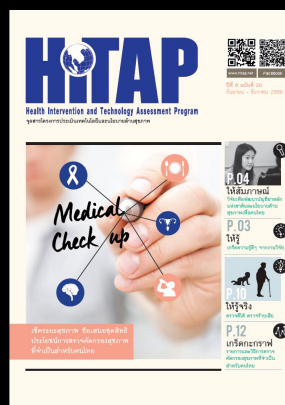
จุลสาร HITAP ปีที่ 6 ฉบับที่ 20 กันยายน-ธันวาคม 2556 ฉบับ เชื้อระยะสุขภาพ ภาค 2: ตรวจดีได้ ตรวจร้ายเสีย