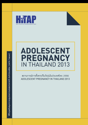
Adolescent Pregnancy สถานการณ์การตั้งครรภ์ในวัยรุ่นของประเทศไทย